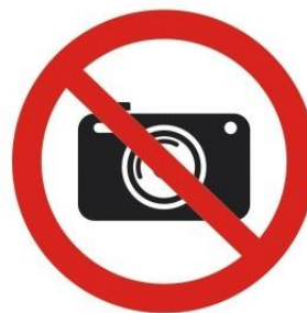
ФОТО ВИДЕОСЪЕМКА ЗАПРЕЩЕНА

Надо обязательно помнить, что по закону нельзя снимать военные объекты, местонахождение армейских частей.